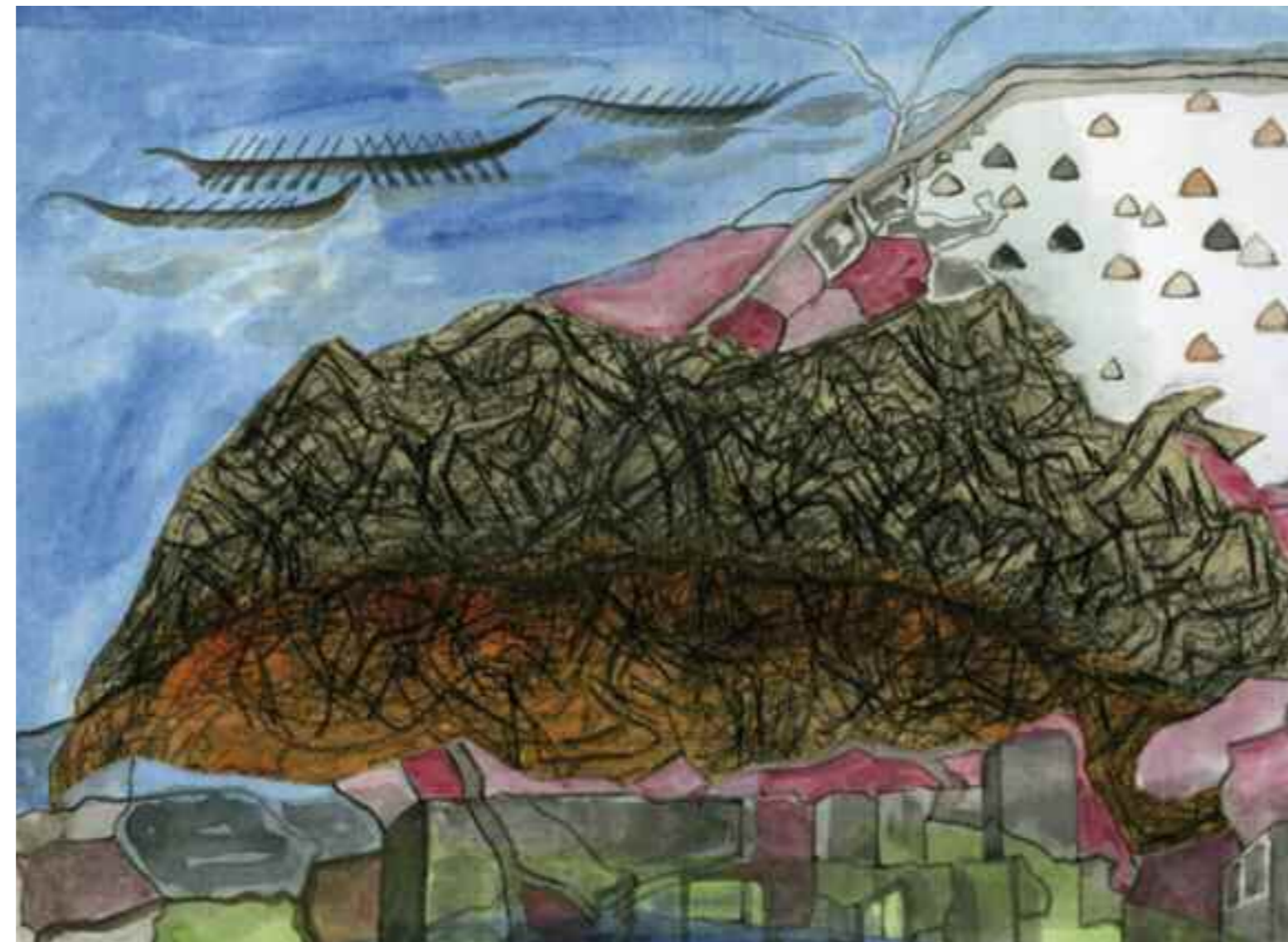
ABESH BIVORE MITRA, Transformed Leaf 2 Landcape, water colour 29.5 x 20.5 cm, 2007