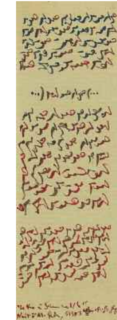
« Lettre à Samael/le. Nuit d'Al-Qadr », 1983. Encre rouge sur papier, 70 x 200 mm. Fonds Bernard Noël de la Bibliothèque Littéraire Jacques Doucet.