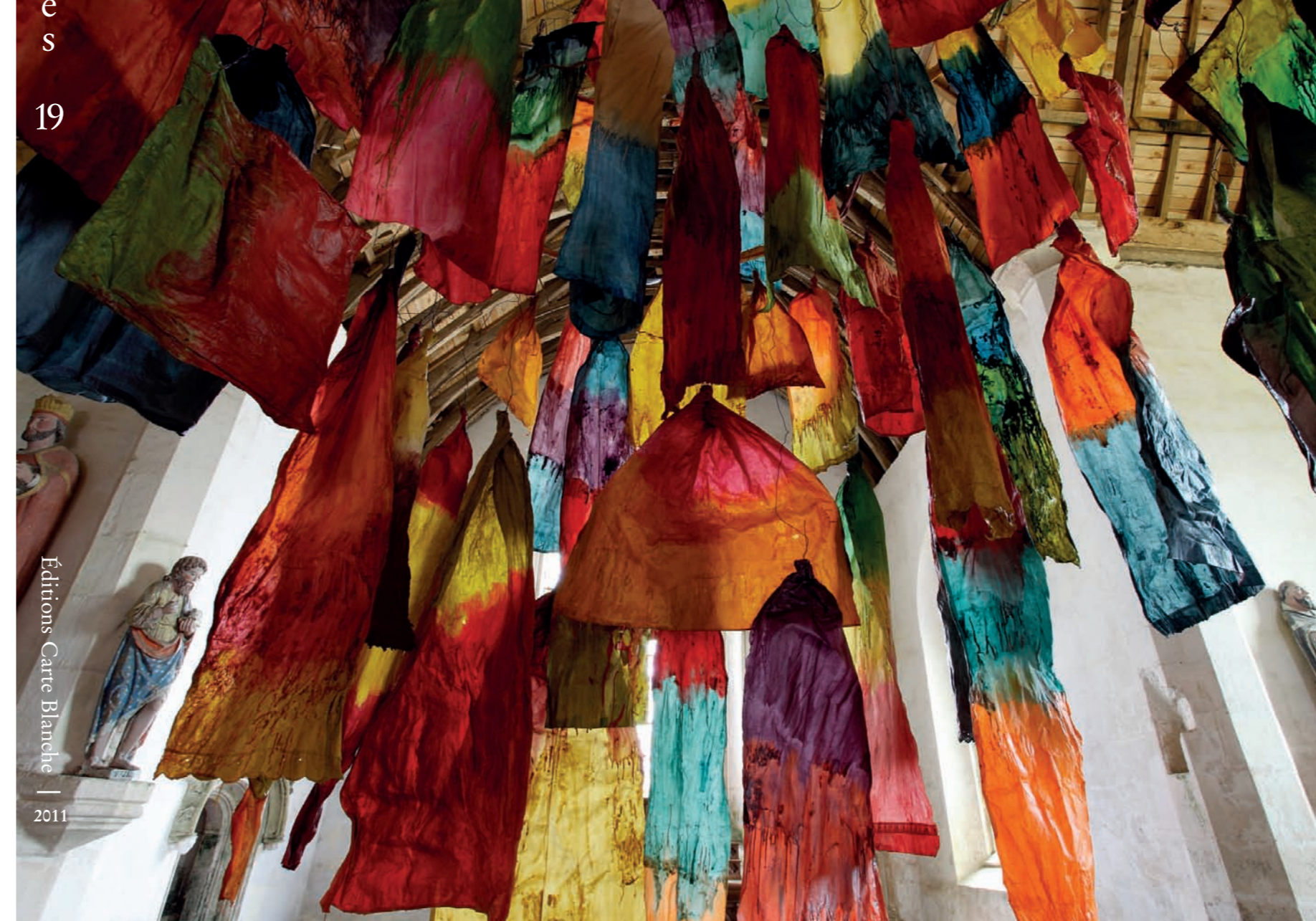
Éditions Carte Blanche 2011